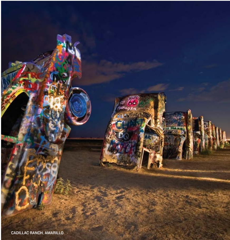
CADILLAC RANCH, AMARILLO