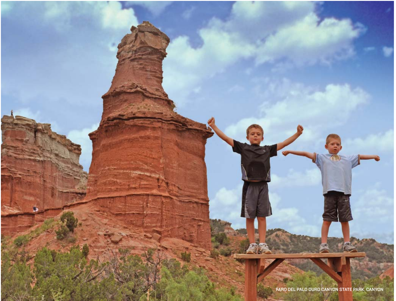
FARO DEL PALO DURO CANYON STATE PARK, CANYON